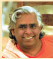
Swami Vishnudevananda (1927-1993)